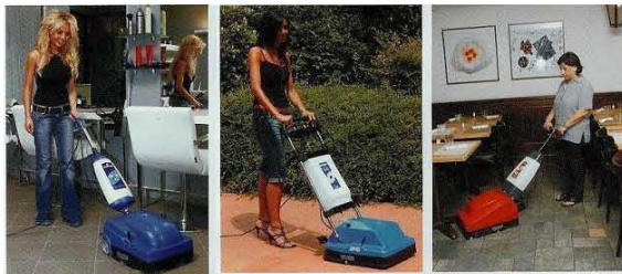
FRIEGA Y SECA EN UNA SOLA PASADA....