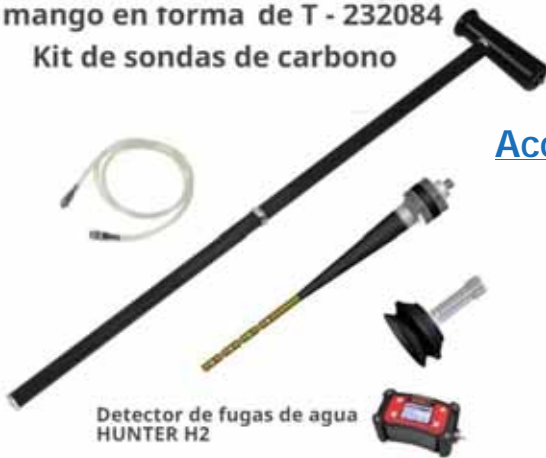
Detector de fugas de agua HUNTER H2

mango en forma de T - 232084 Kit de sondas de carbono