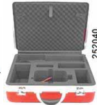
252040 Maletín de transporte aluminio para HUNTER